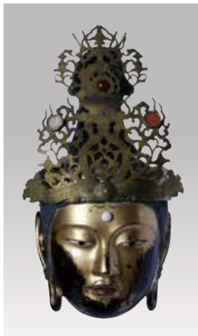
奈良県指定文化財 菩薩面(来迎会所用面) 室町時代 當麻寺