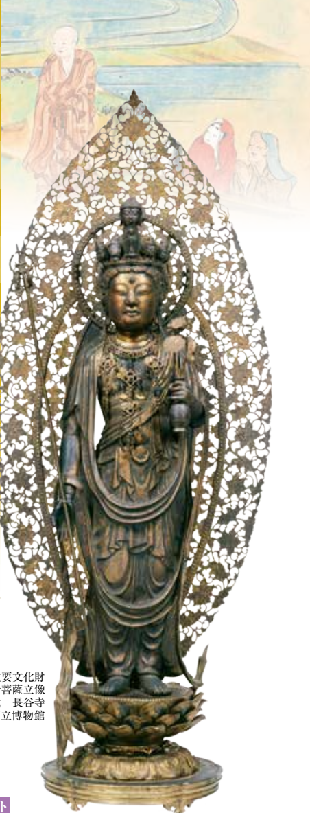
重要文化財 十一面観音菩薩立像 鎌倉時代 長谷寺

Masterpieces of Buddhist Statue in NARA: Pilgrimages to the Ancient Temples