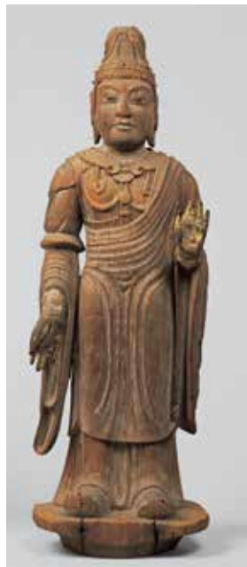
天部形立像(伝帝釈天) 平安時代 唐招提寺

日時:10月12日(土) ①10:30~ ②13:30~ 展覧会見学も含め1時間30分程度 会場:体験学習室 対象:小学校3年生以上(小学生の方は保護者同伴) 定員:各回4組(事前申込が必要、定員になり次第終了) 申込先:山梨県立博物館 電話:055(261)2631 ※参加無料、9/14(土)より申込受付開始