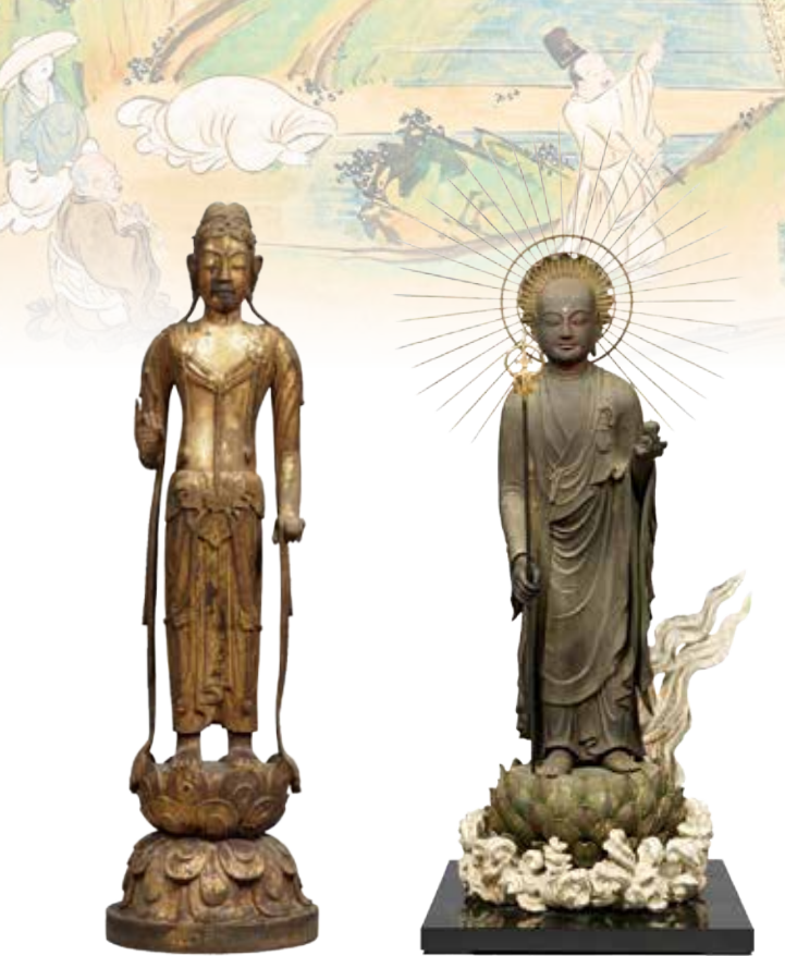
重要文化財 普賢菩薩立像(六観音のうち) 飛鳥時代 法隆寺