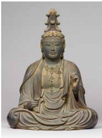
奈良県指定文化財 文殊菩薩騎獅像 鎌倉時代 法華寺